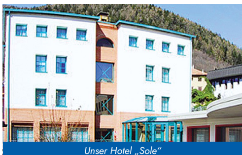
Unser Hotel „Sole“